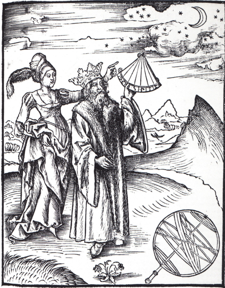
Margarita Philosophica de Gregor REISCH (1503)

Cette gravure représente Claude PTOLÉMÉE (100 – 168) aux côtés d'une femme symbolisant l'astronomie.